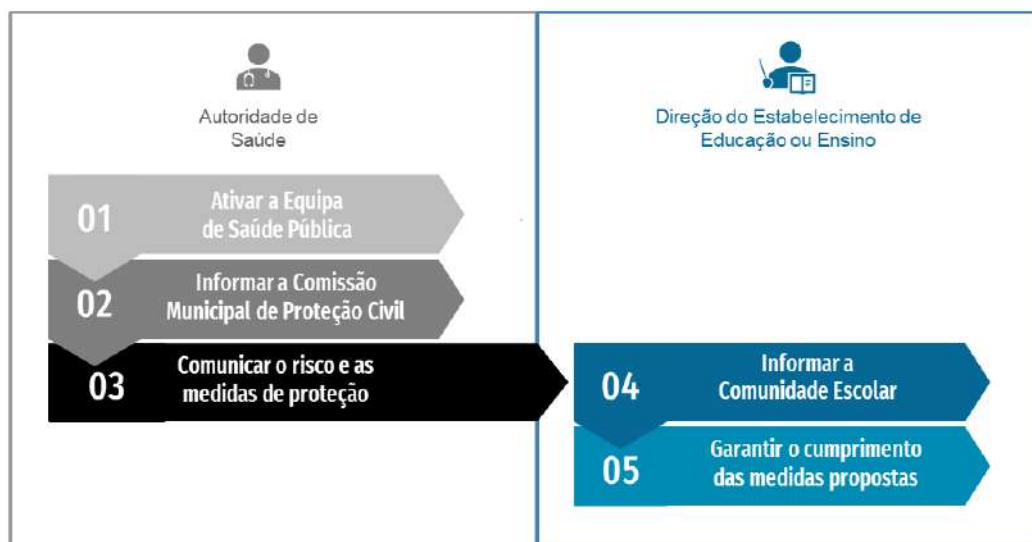
Figura 3. Fluxograma de atuação perante um surto em contexto escolar